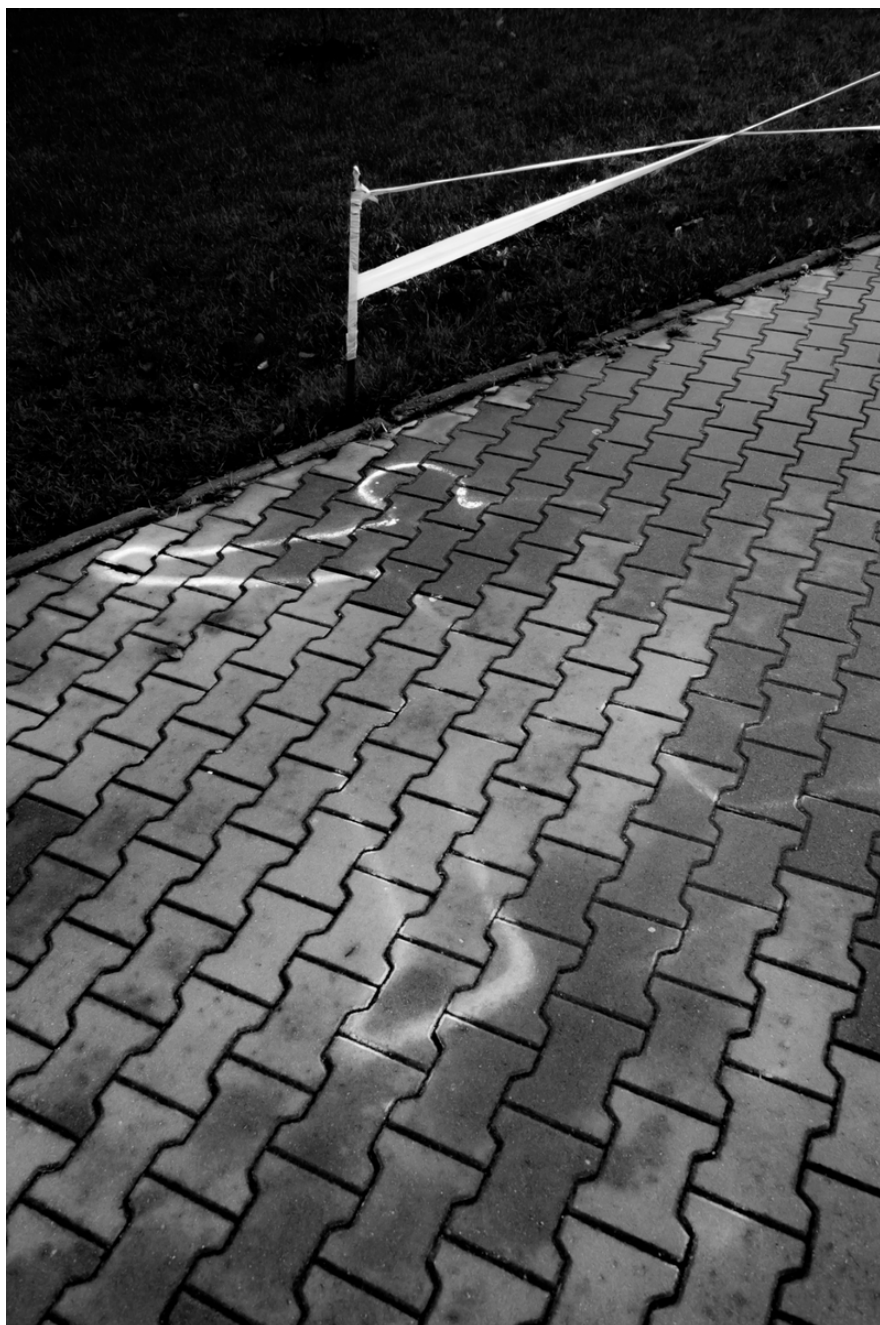
■ Post „Do you think outside the box?”

„Big Brother” to mój pierwszy post zainspirowany twórczością Stanisława Lema. Znany polski autor powieści science-fiction jest jednym z moich ulubionych, obok Fiodora Dostojewskiego, pisarzy. Warto wspomnieć, że ten projekt był moim zgłoszeniem w jednym z konkursów Lens Culture. Dzisiaj nie będę więcej pisać o tym poście. Na końcu październikowej edycji "Dzienników" znajdziesz całą treść króciutkiego opowiadania.