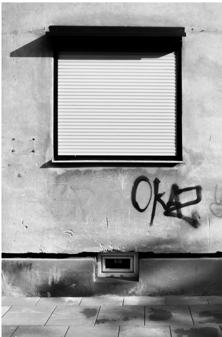
■ Post „Big Brother” (również str. 8 oraz 10)