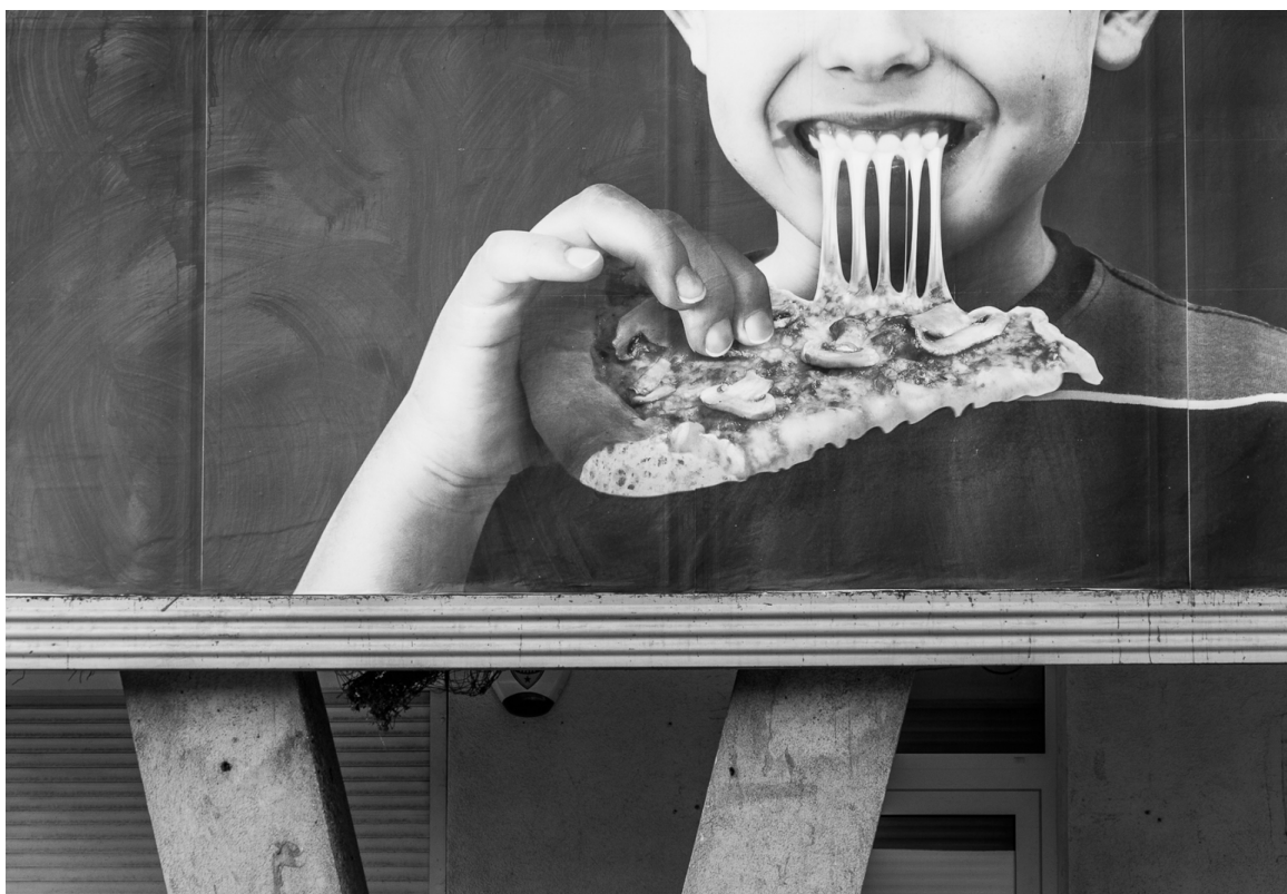
■ Post "Who wants to live forever?"

Jeśli chodzi o drugi sposób, jest wielu zmarłych ludzi (artystów, filozofów, naukowców itp.), którzy wciąż wspaniale inspirują innych. W moim poście wspominałem takich ludzi jak: Seneka, Leonardo da Vinci, Fiodor Dostojewski, Anton Czechow, Henri Cartier-Bresson, Stanisław Lem, Stanley Kubrick, Freddie Mercury lub David Bowie. Wszyscy ci ludzie i wielu, wielu innych, wciąż żyją we wspomnieniach ludzkości. Dlatego zawsze zachęcam wszystkich moich Czytelników do tworzenia nowych rzeczy. Bez względu na to, czy tworzysz fotografie, obrazy, teksty, piosenki i tak dalej. Jest to jeden z najlepszych sposobów na życie wieczne, we wspomnieniach potomnych.