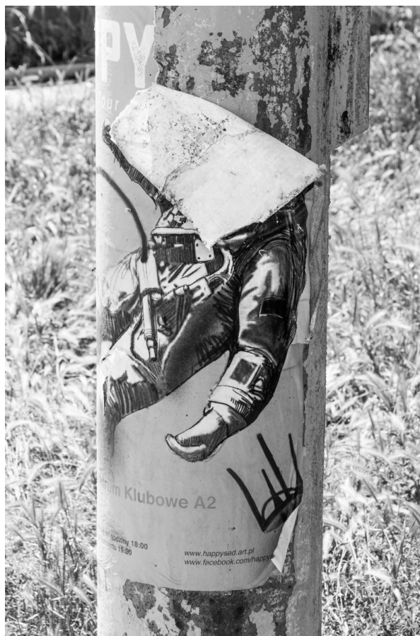
Post "Can you hear me, Major Tom?" (Również obok). Okładka: post "Big Brother".

Zarówno piosenka o Majorze Tomie, jak i film Kubricka opowiadają o śmierci i „Nieznanym” ukrytym gdzieś w kosmosie. Podnoszą pytanie o istnienie człowieka w całym Wszechświecie. Nie przynoszą żadnych odpowiedzi, tylko dalsze pytania i wątpliwości. W tym poście zacząłem głośno marzyć, o tym, że może moje zdjęcia staną się kiedyś tak sławne, jak muzyka Bowie czy filmy Kubricka. Wyobrażam sobie, że moja twórczość będzie inspirować innych ludzi w podobny sposób, jak robi to do dzisiaj artystyczna spuścizna dwóch ww. geniuszy. Czy major Tom, „unoszący się wokół swojej puszki, daleko nad Księżycem”, usłyszy mój głos?