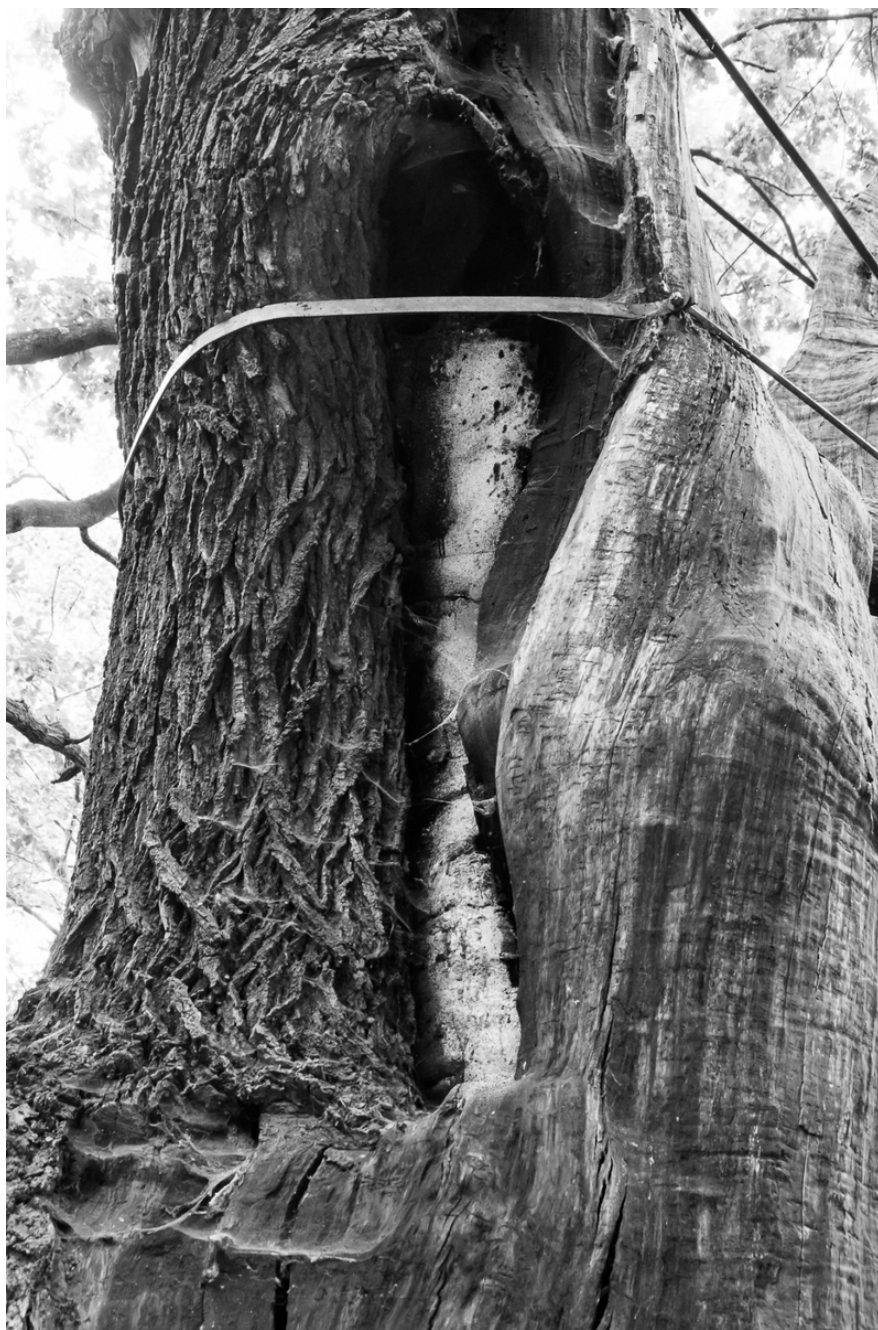
■ Post „Do you think outside the box?”

Kiedy przestaję myśleć i zaczynam robić rzeczy związane z relaksacją, pomysły same przychodzą mi do głowy. Relaks może przynieść wiele inspiracji. Nowe pomysły często nieświadomie pojawiają się w naszej wyobraźni. Ta praktyka działa dla mnie bardzo dobrze. Jeśli chcesz myśleć nieszablonowo, zachęcam Cię, mój Drogi Przyjacielu, abyś po prostu przestał myśleć. Odpręż się i opróżnij umysł. Najlepsze rozwiązania skomplikowanych problemów pojawiają się szybciej, niż się spodziewasz. Mówiąc krótko: pamiętaj, że odpoczynek jest równie ważny, jak ciężka praca. Właściwy, regularny relaks zapewni ci wiele korzyści, w tym nowe, świeże podejście do wielu problemów.