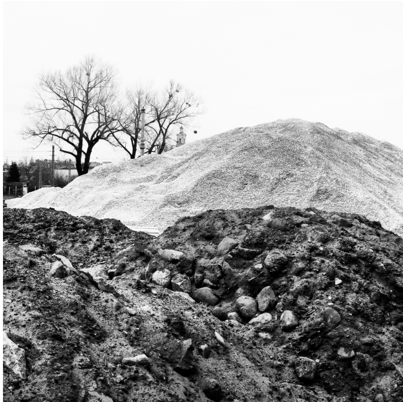
■ Post "How to find beauty in our daily routine?" (również poniżej)

W kolejnym poście („How to find beauty in our daily routine?”) wspomniałem, że jestem przekonany, iż każdego dnia, w każdym miejscu na naszej planecie, wszyscy ludzie mogą dostrzec wiele fascynujących widoków, które warto uwiecznić na zdjęciach. Problem polega na tym, że większość z nas nie dostrzega tych magicznych obrazów. Ludzie często są zbyt zaabsorbowani innymi rzeczami, aby skupić się na wizualnej analizie otoczenia. Co więcej, ci, którzy zauważają osobliwe widoki, zazwyczaj nie mają czasu, żeby robić zdjęcia. Wreszcie, ci, którzy mają czas, nie zawsze potrafią uchwycić ten moment tak dobrze, jak by chcieli.